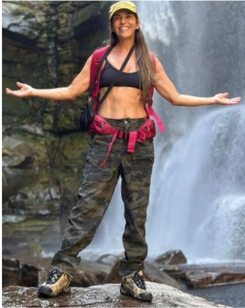
@zara.bueno - De bem com a vida, de bem com a natureza!