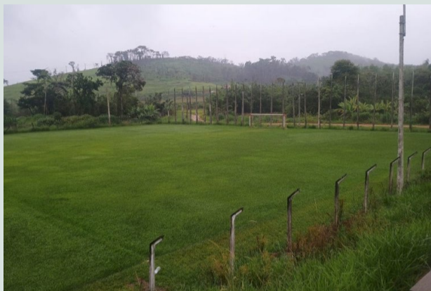
O pequeno Campo do Couceiro vai virar estádio completo