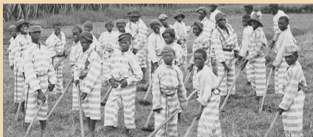
A escravidão nos Estados Unidos acabou no dia 31 de janeiro de 1865

A emenda está assim redigida: Emenda XIII, Seção 1: Não haverá, nos Estados Unidos ou em qualquer lugar sujeito a sua jurisdição, nem escravidão, nem trabalhos forçados, salvo como punição de um crime pelo qual o réu tenha sido devidamente condenado; Seção 2: "O Congresso terá competência para fazer executar este artigo por meio das leis necessárias".