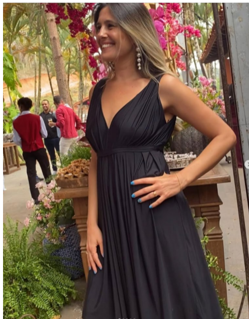
@raquelglinhares - Vamos construindo ideias!