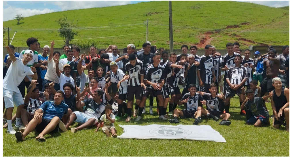
Os animados garotos do Minas E.C comemoram o título de campeão Su-17