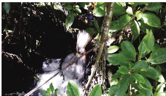
Nascente do Rio Piranga, na Serra da Trapizonga, em Ressaquinha

em todo o estado de Minas Gerais. É uma satisfação enorme poder fazer parte da atual coordenação do FMCBH, condição que exige responsabilidade e compromisso com o meio ambiente e a população", destacou o ponte-novense.