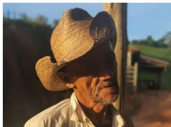
Idoso foi resgatado por auditores fiscais do MPT-MG, em Rio Casca em situação análoga à escravidão

Em Minas Gerais, o Ministério Público do Trabalho (MPT-MG) abriu 248 procedimentos para investigar situações de submissão da pessoa humana a trabalho