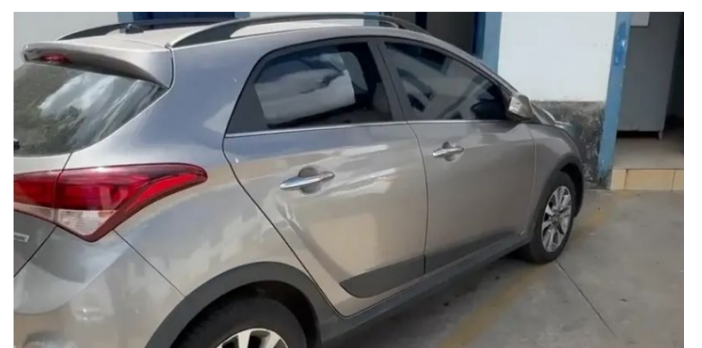
Carro clonado estava com o homem preso em Ouro Preto

De acordo com informações obtidas, o indivíduo era temido por seus inimigos por apresentar habilidades no manuseio de armas de fogo e se vangloriava de possuir treinamento militar por ter servido ao Exército brasileiro.