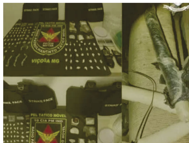
Droga e material apreendido pela PM que divulgou o resultado da operação

Durante a operação, os policiais militares