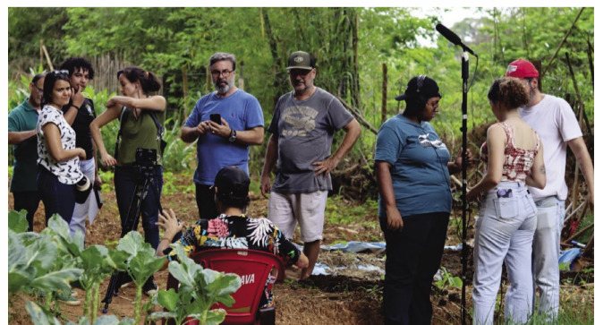
Na Horta Comunitária de Copacabana: momento de preparação para tomada de cena

O outro documentário recebeu o título Agentes Transformadores , com 13 minutos de duração. Produzido no contexto da Oficina de Produção Cinematográfica Curta Ambiental, traz uma mensagem de esperança e ação para um dos maiores desafios urbanos contemporâneos: o lixo. Focado na Coopnova (Cooperativa de Trabalho dos Recicladores de Ponte Nova) e na Horta Comunitária de Copacabana, Agentes Transformadores mostra como atitudes simples e soluções criativas podem mudar a realidade de nossa cidade. O filme traz a força de pessoas que, com suas mãos e corações, estão fazendo a diferença, não apenas preservando o meio ambiente, mas criando um futuro mais sustentável e colaborativo.