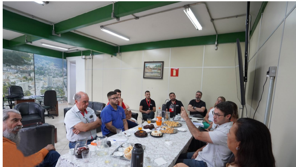
Profissionais de imprensa se encontram com novos governantes em 28 de janeiro

doviária já está conversado com DER-MG (Departamento de Estradas de Rodagem de Minas Gerais) e em breve fica pronto. Com isso, o espaço da Rodoviária Nova