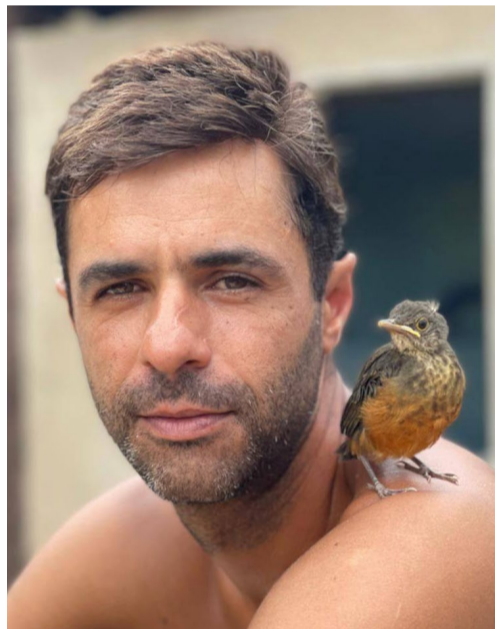
@hudsonalvesfernandes - Boa companhia sempre!