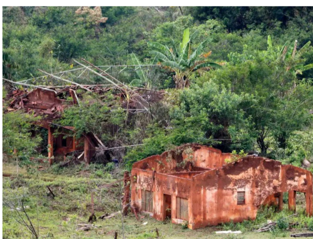
Tragédia de Mariana deixou 19 mortos

A repactuação envolve R$ 170 bilhões e foi assinada por diversos órgãos públicos, incluindo a União, os