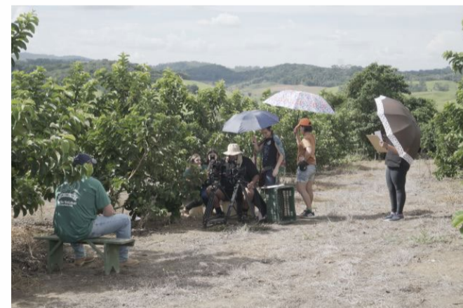
No meio rural, os preparativos para filmagens de Doce Herança