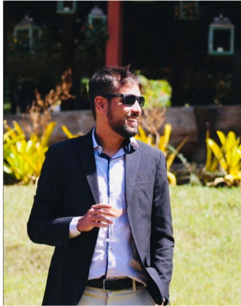
@gustavofernandes - Com imaginação e arte!