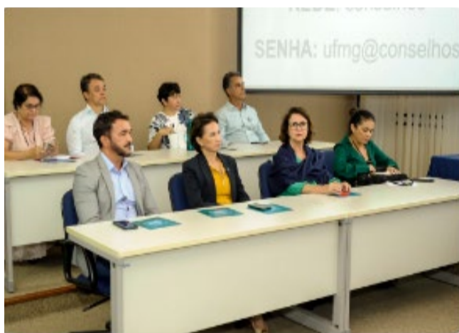
Debate sobre a Rede Mineira de Formação de Professores da Educação Básica teve representantes de 19 instituições

a educação básica em um contexto de 'apagação' de professores e de precarização da profissão".